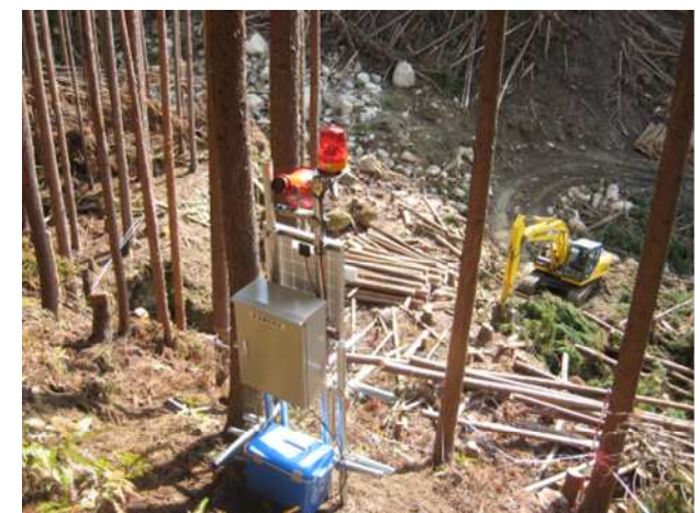
計測・監視盤イメージ