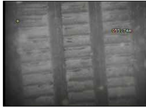
スクリーンの目詰まり状態