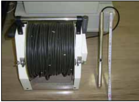
カメラ本体とケーブル