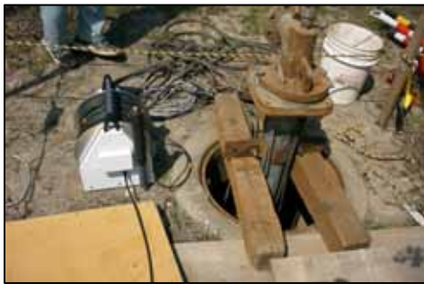
井戸への挿入風景(ポンプの脇から挿入)