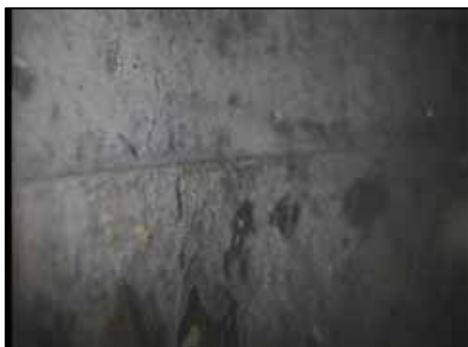
ケーシングの接続部(側面カメラ)

カメラ長/420mm カメラ外径/φ23mm ケーブル/φ8mm×100m カメラ撮像素子/1/4インチCCD カメラ撮像素数/41万画素 フォーカス/画視:固定 画視:調整機能付き 耐圧性/水中1MPa(水深100m)