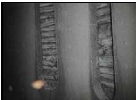
ストレーナの巻線の腐食状況