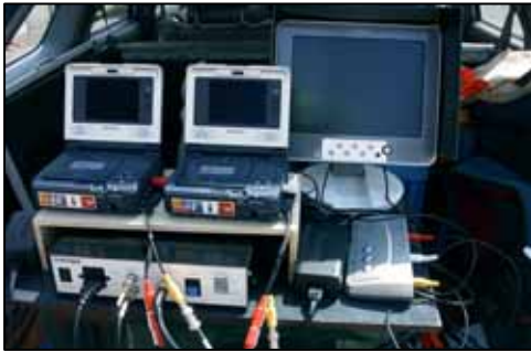
地上のモニター装置