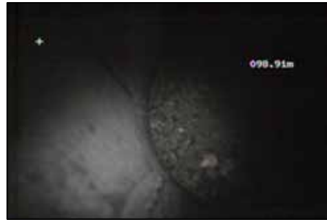
井戸底の堆砂の様子(底面カメラ)