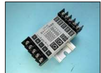
DIN レールへの取付状態